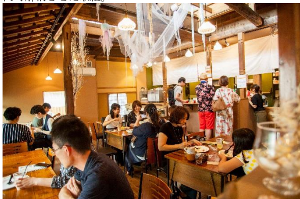
木造家屋を活かした情緒あるカフェは地元住民の憩いの場