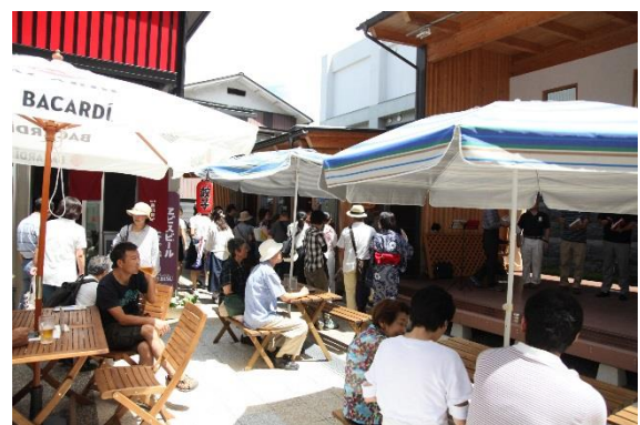
横丁の中央はオープンテラスになっており、賑わいの空間として利用されている。