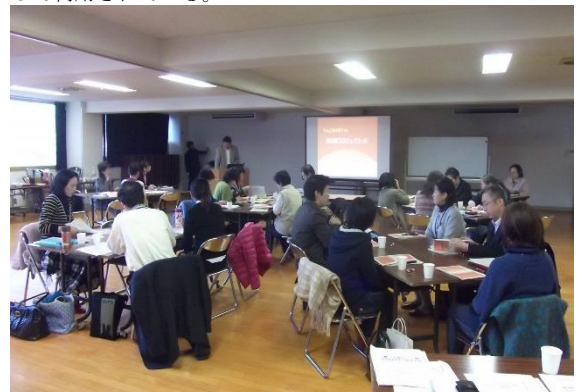
各店舗の事業継続性を高めるため、起業・創業者を育成支援する「創業塾」を開設。