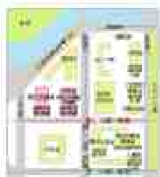
補足説明例：国土交通省ホームページに掲載しているアクセスマップ