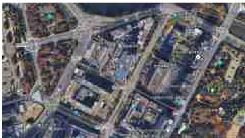
補足説明例：国土交通省周辺の航空写真